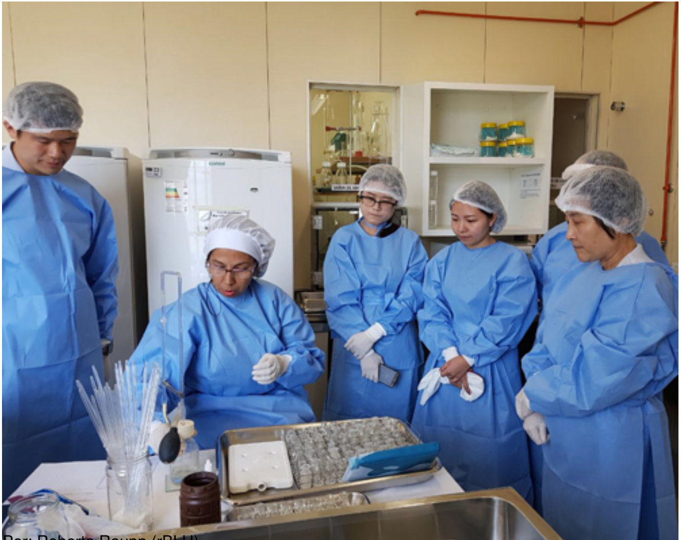
Por: Roberta Raupp (rBLH)