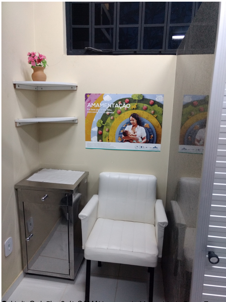
Sala de Apoio à Amamentação (BLH-MDER) da Unidade de Pronto Atendimento (UPA) da Maternidade Dona Evangelina Rosa (BLH-MDER)