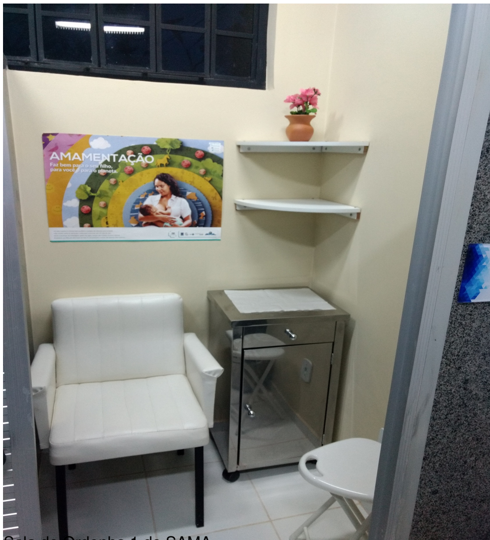
Sala de Ordenha 1 do SAMA