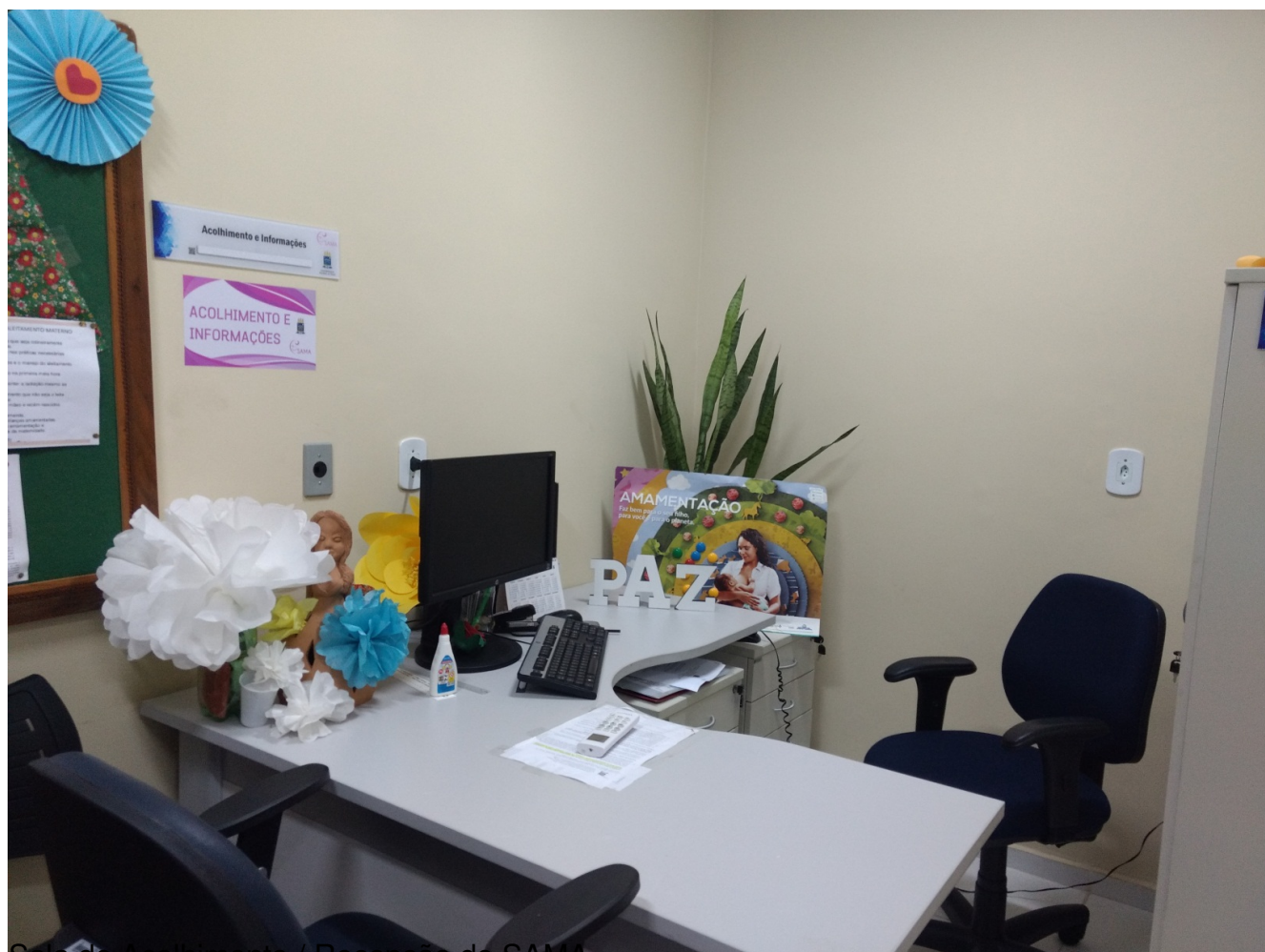
Sala de Acolhimento / Recepção do SAMA