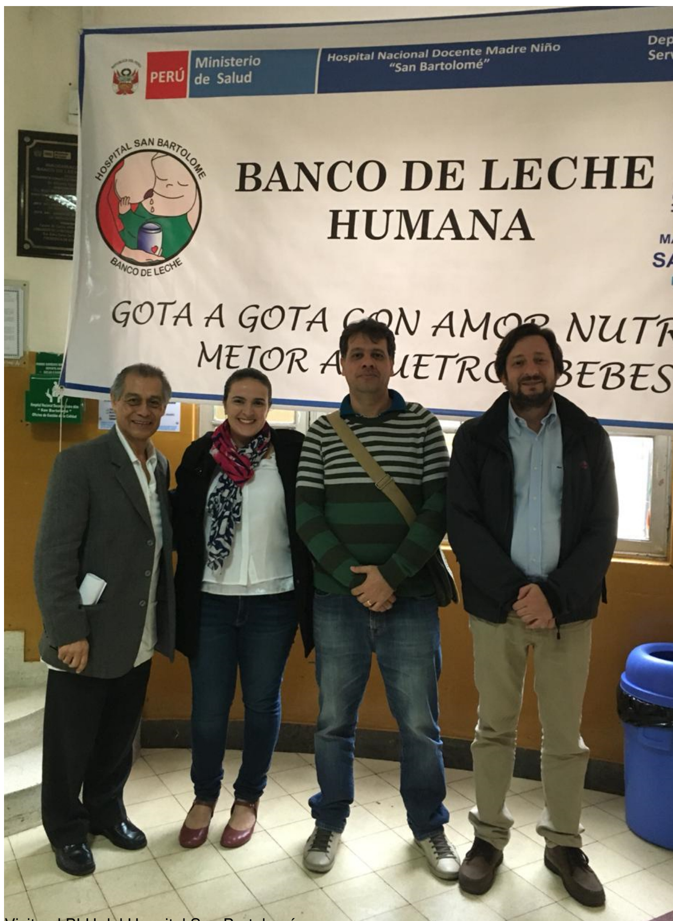
Visita al BLH del Hospital San Bartolomé