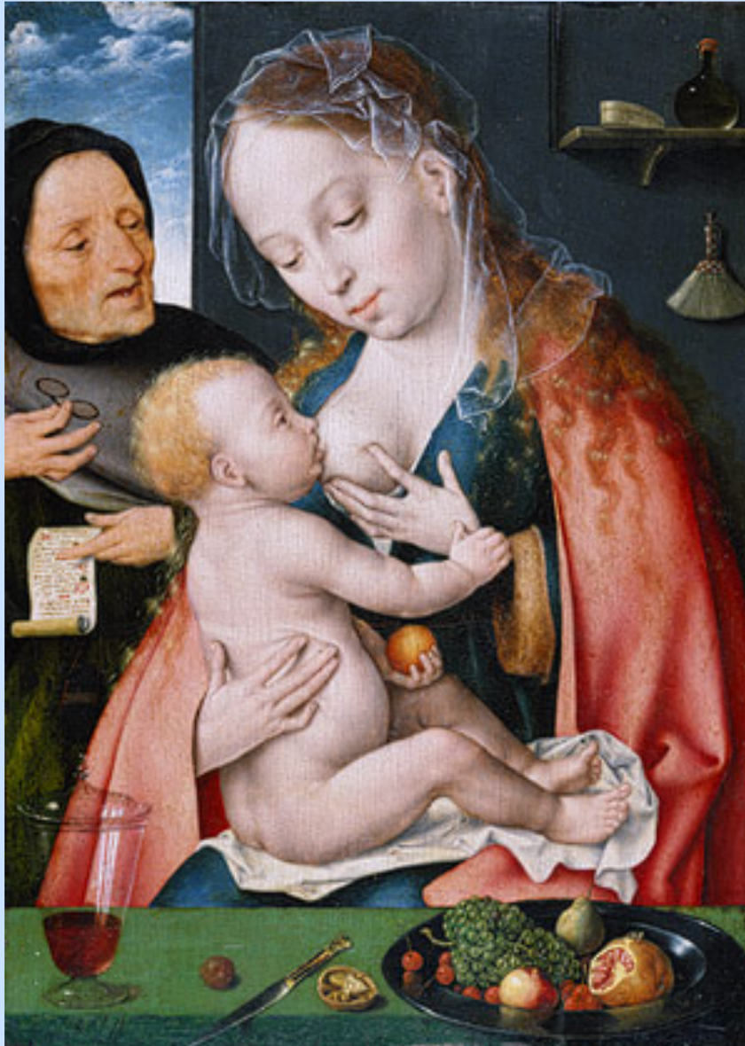
The Holy Family, ca. 1512–13