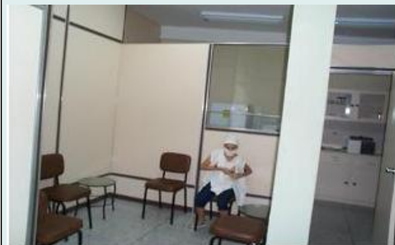
Sala de Coleta

Envíen las fotos de sus Bancos de Leche para iberblh@fiocruz.br