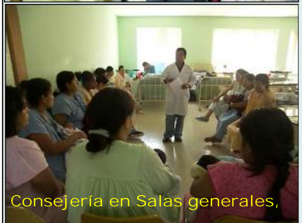
Consejería en Salas generales,