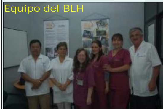
Equipo del BLH

Basados en este convenio y en la experiencia institucionalizada como Política de Salud en Bancos de Leche Humana en la República Federativa del Brasil, que mantienen una presencia y reconocimiento científico a nivel mundial desde hace varias décadas y sustentados en la RED DE BANCOS DE LECHE DEL BRASIL, en marzo del 2007, en el marco del "Seminario- Taller Internacional Teórico Práctico sobre Manejo de Banco de Leche Humana" realizado en Quito, se creó el primer Banco de Leche Humana del Ecuador en el Hospital Gineco-Obstétrico "Isidro Ayora" de Quito.