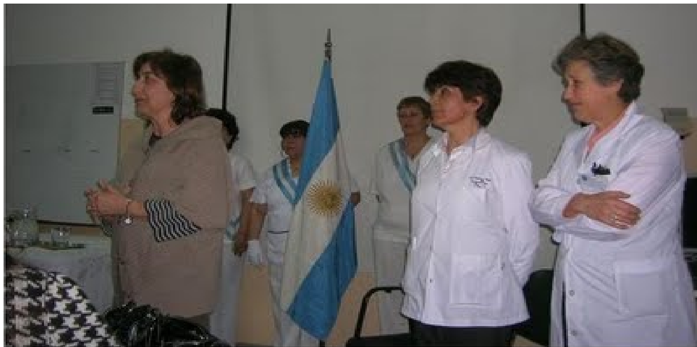
Inauguración Banco de Leche Humana Pasteurizada Hospital Materno Infantil "Ramón Sardá" Ciudad Autónoma de Buenos Aires, 22 de septiembre 2009

Banco de Leche Humana del Hospital Materno Infantil "Ramón Sardá", Ciudad de Buenos Aires, Argentina