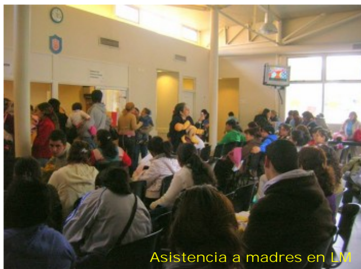
Asistencia a madres en LM

Banco de Leche Humana del Hospital Materno Infantil "Ramón Sardá", Ciudad de Buenos Aires, Argentina