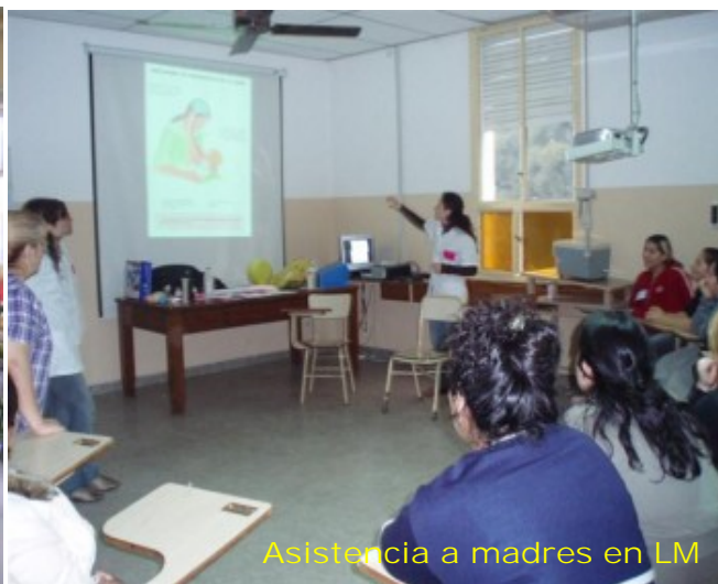
Asistencia a madres en LM