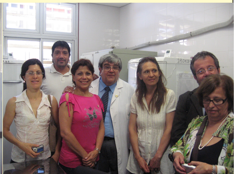
Profesionales de la Provincia de Misiones