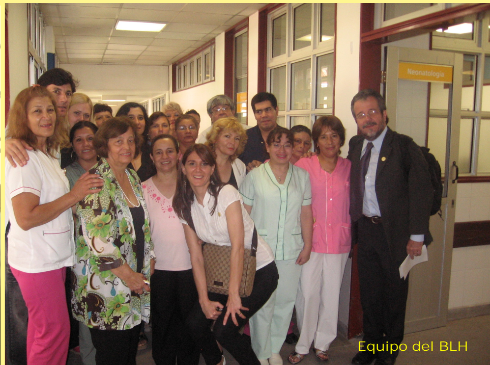
Equipo del BLH