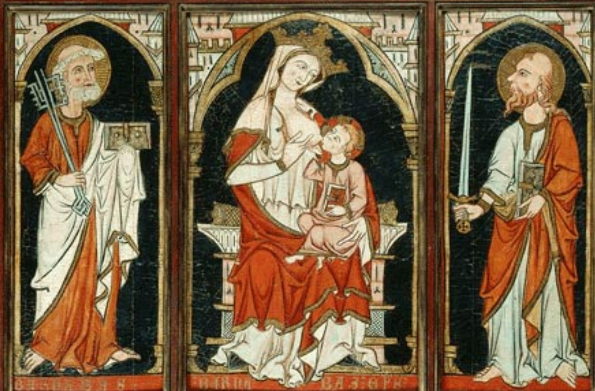
"El Retablo de Bernabé, sudoeste de Francia o el norte español, c. 1275-1350, témpera, óleo y oro sobre tabla. Kimbell Art Museum Autor: Desconocido