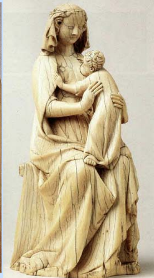
Anónimo Francés 1335