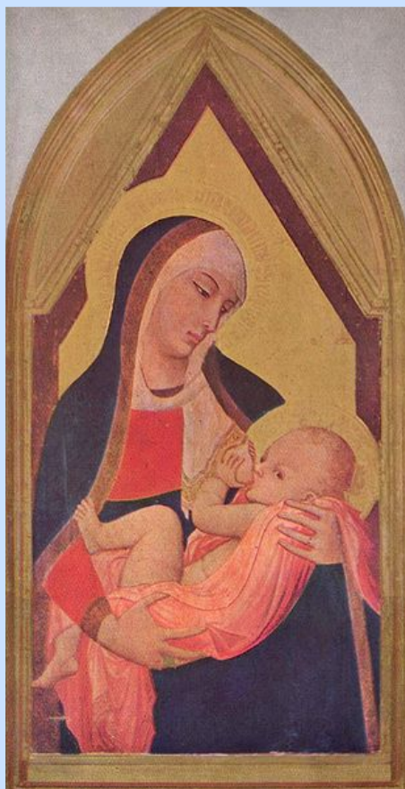
Madonna del Latte (Maria lactans) Autor: Ambrogio Lorenzetti Pinacoteca Nazionale di Siena. 1330