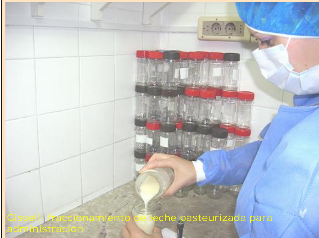
Gissell: fraccionamiento de leche pasteurizada para administración

Mamás donantes del banco. Todos sabemos que tan importante como tener un personal responsable e involucrado con la tarea es tener madres donantes sin las cuales nada de lo que hacemos sería posible.