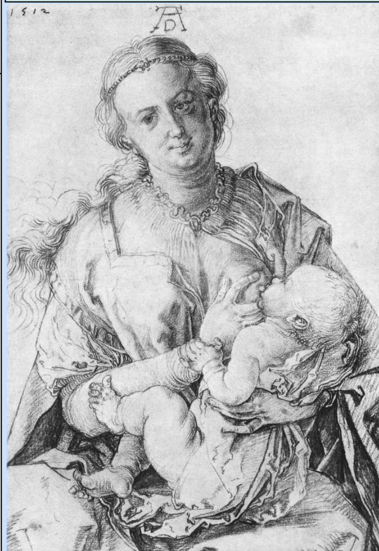
The Virgin Nursing the Child