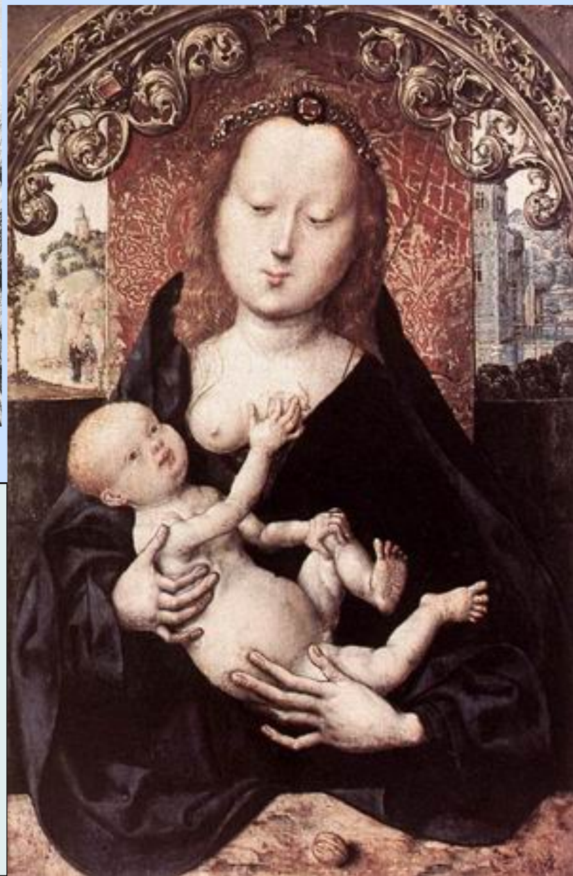
MASTER of the St. Bartholomew Altar (active 1470-1510 in Cologne)