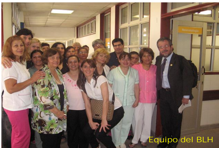
Equipo del BLH