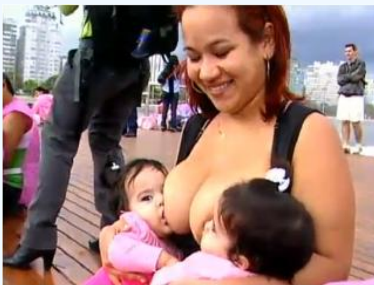
Imagen de la TV

El BLOG IberBLH es una herramienta más para comunicarnos, hacer comentarios, sugerencias. Pueden dejarnos comentarios sobre las actividades en sus bancos de leche humana, novedades en lactancia materna, experiencias a compartir, comentar los boletines, enviarnos fotos, entre otras tantas cosas.