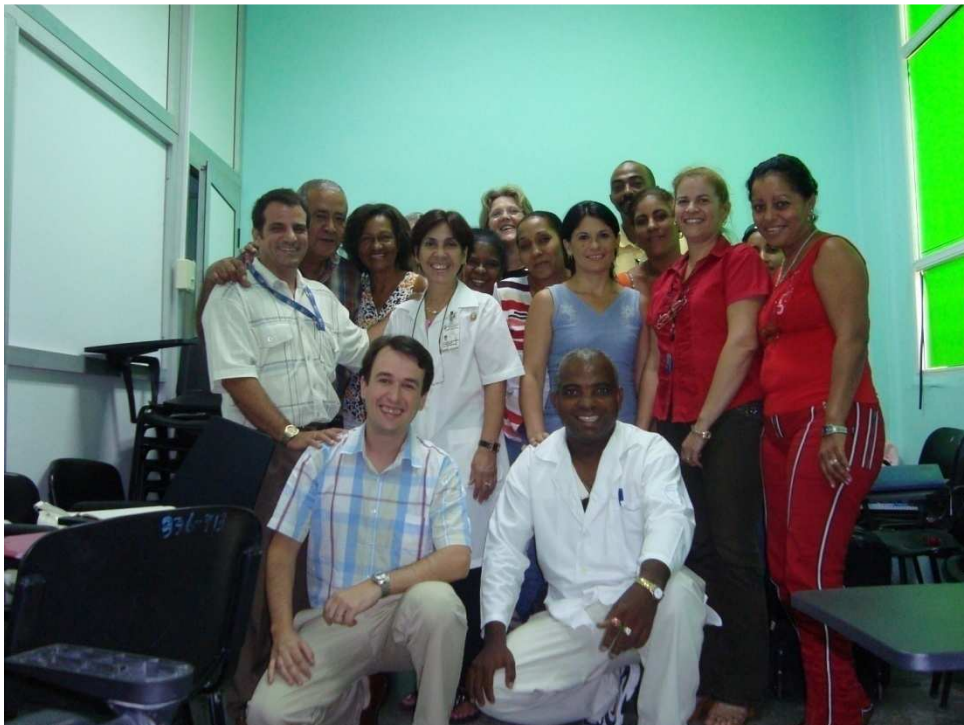
Participantes del Curso de Procesamiento y Control de Calidad en Bancos de Leche Humana en La Habana/Cuba.