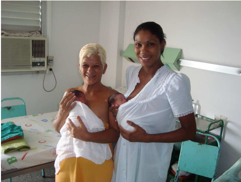
Los gemelos, con su madre y abuela, recibiendo los cuidados “piel a piel” – madre y abuela canguro en el Hospital General Abel Santamaría Cuadrado, en Pinar del Río.