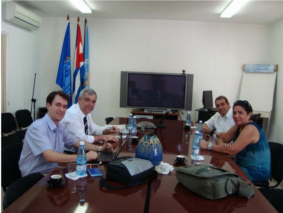
Reunión con representantes de la Red IberBLH, el Ministerio de Salud de Cuba, y OPS de Cuba.