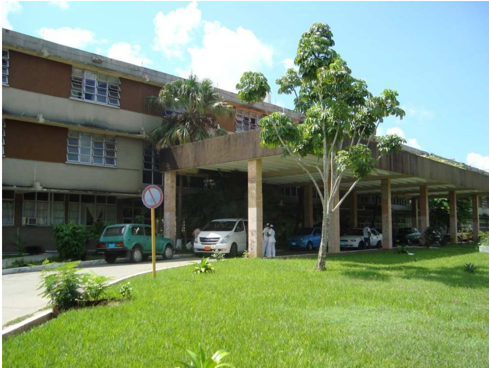
Hospital General Abel Santamaría Cuadrado, en Pinar del Río.