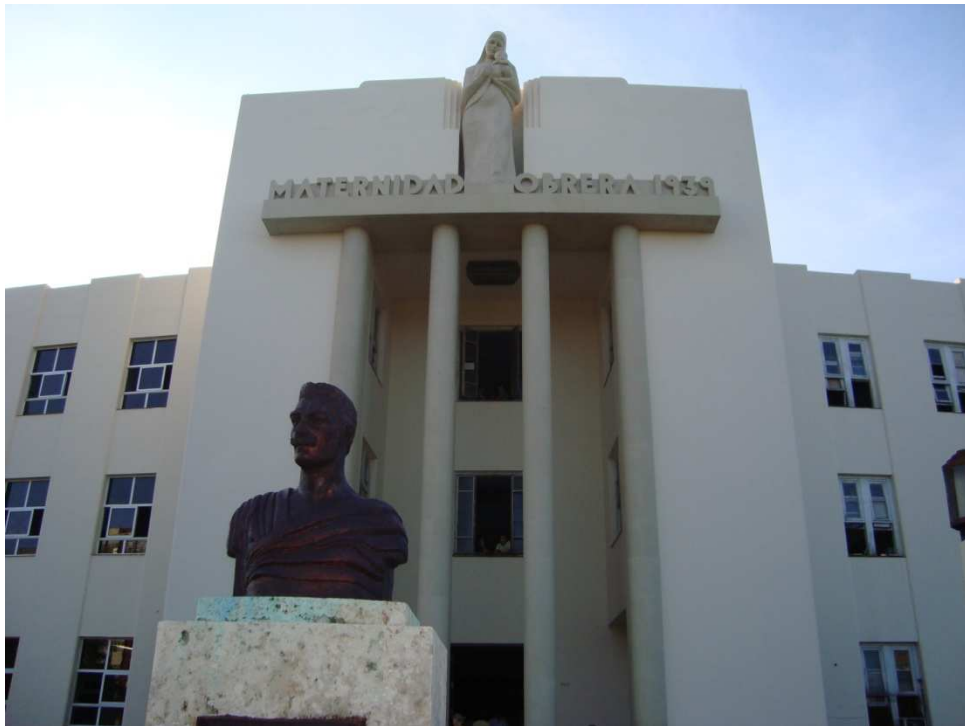
Maternidad Obrera, donde fue realizado parte del Curso de Procesamiento y Control de Calidad en Bancos de Leche Humana en La Habana/Cuba.