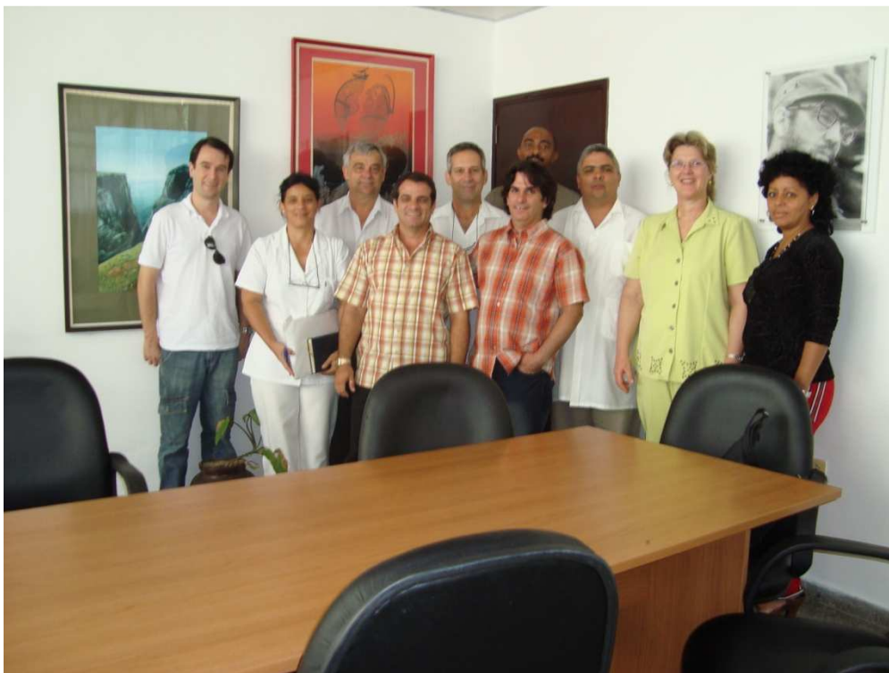
Reunión con representantes de la Red IberBLH, el Ministerio de Salud de Cuba, y la Dirección del Hospital General Abel Santamaría Cuadrado, en Pinar del Río.