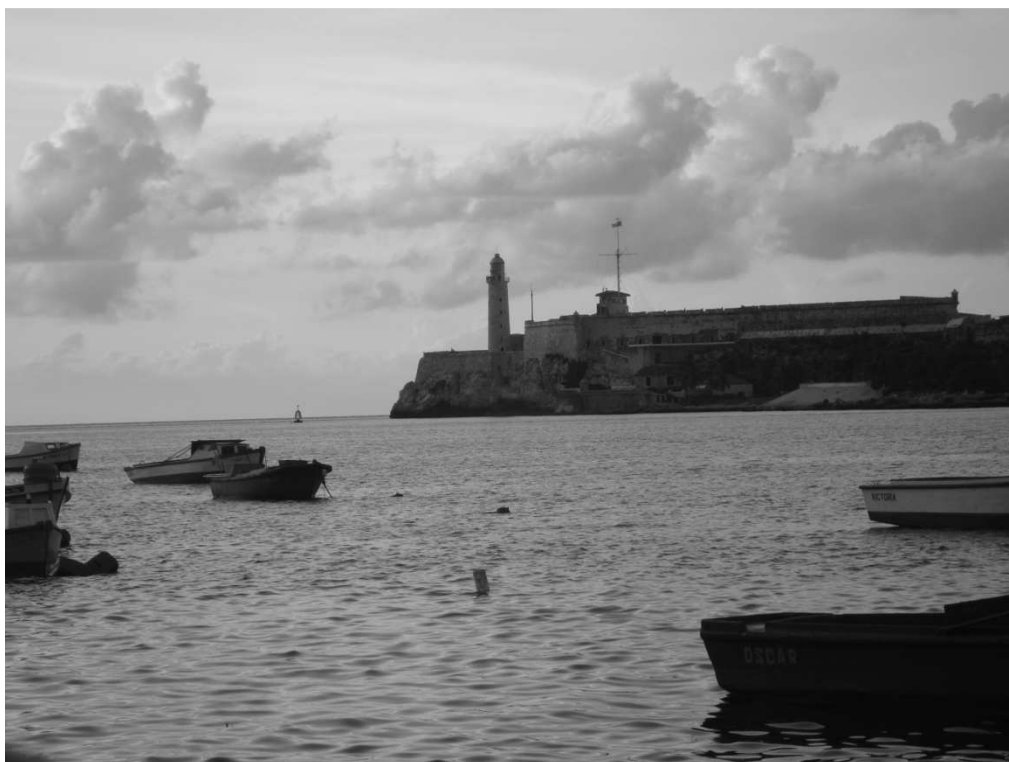
Faro de La Habana – Cuba