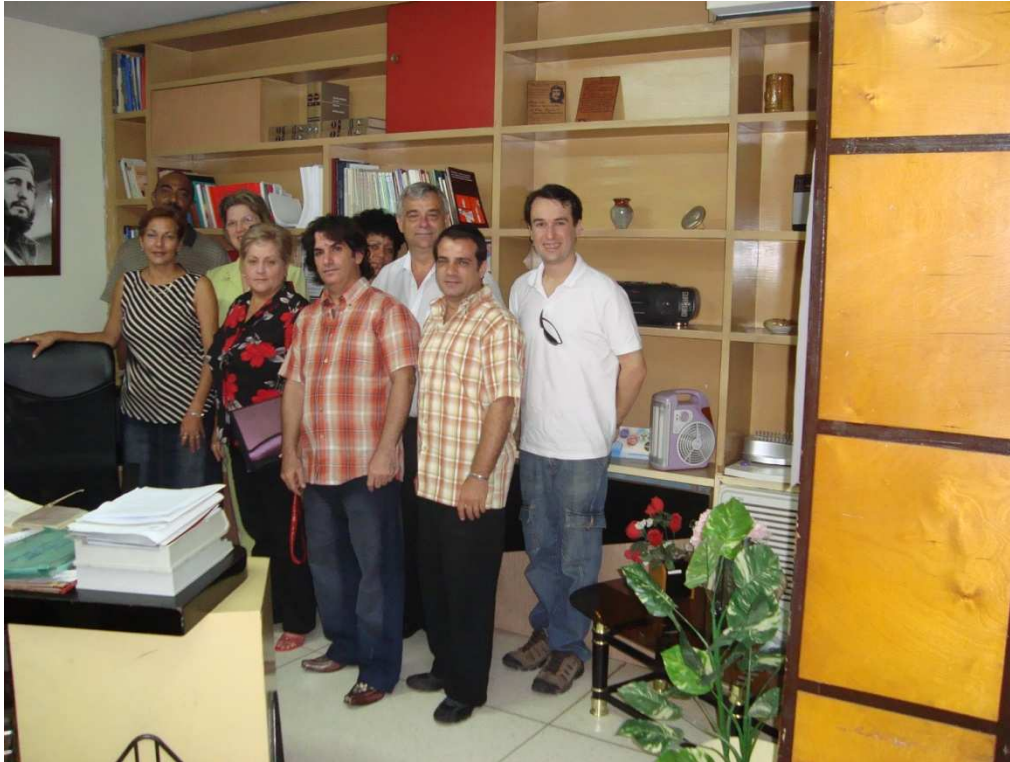
Reunión con representantes de la Red IberBLH, el Ministerio de Salud de Cuba, y la Dirección Provincial de Pinar del Río.