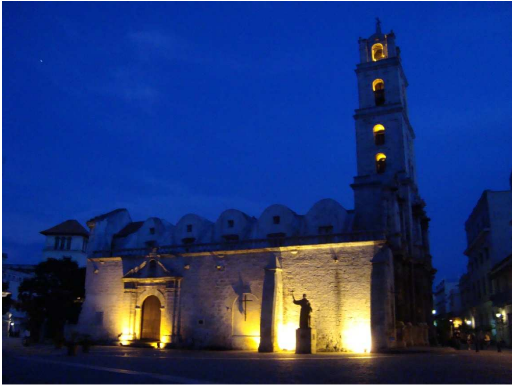
Plaza en La Habana - Cuba