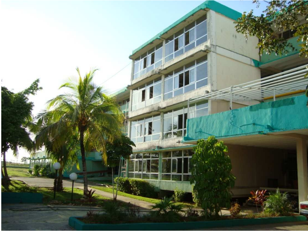
Escuela de Enfermería República del Panamá, donde fue realizado parte del Curso de Procesamiento y Control de Calidad en Bancos de Leche Humana.