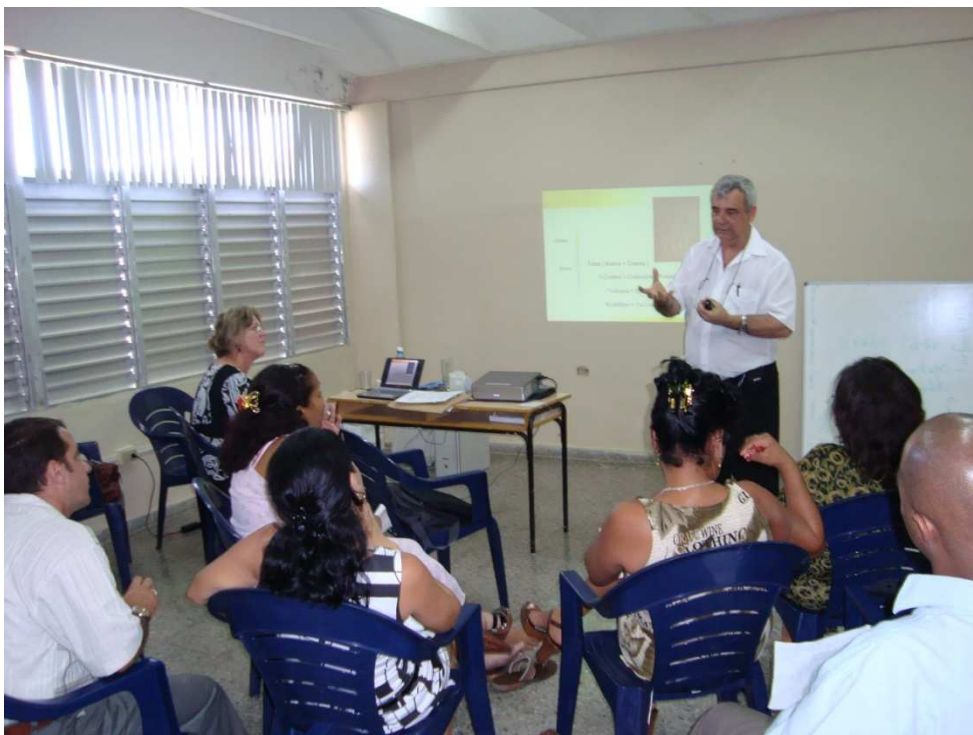
Curso de Procesamiento y Control de Calidad en Bancos de Leche Humana.