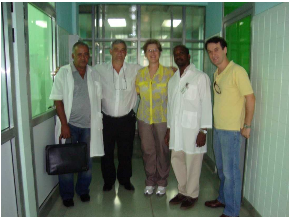
Representantes de IberBLH y de la Maternidad Obrera.