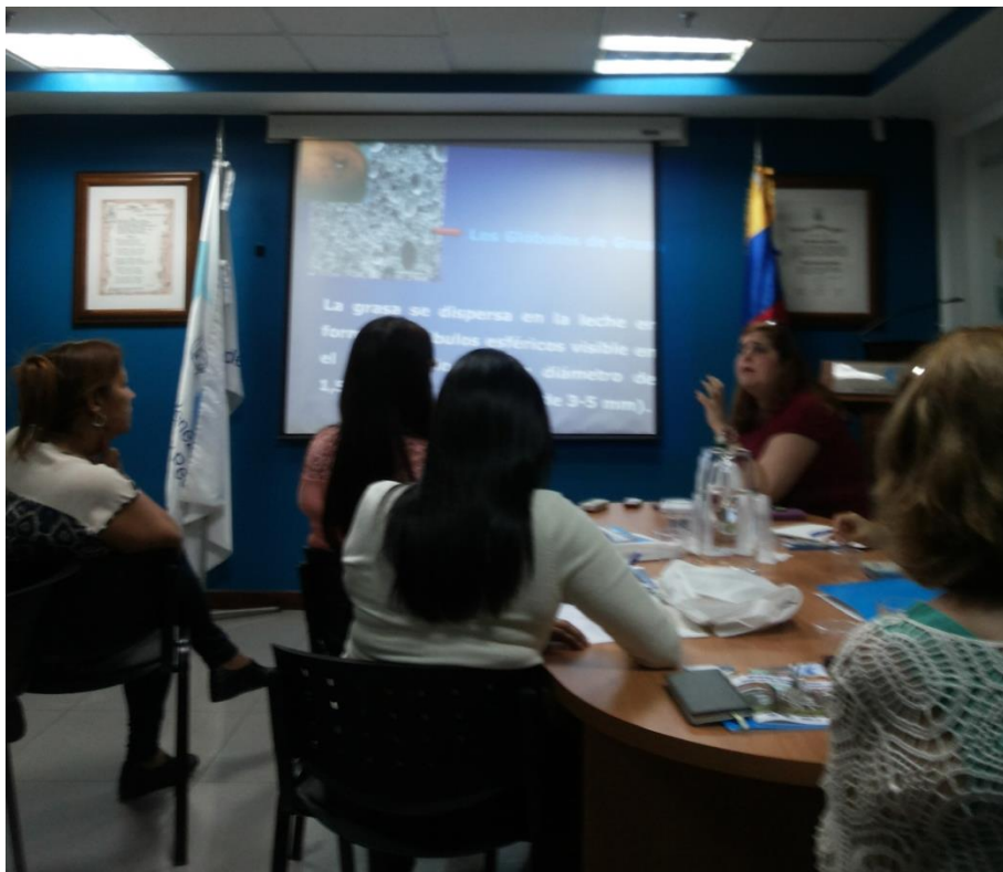
Sesión Teórica del Curso Medio de Bancos de Leche humana y Lactarios institucionales