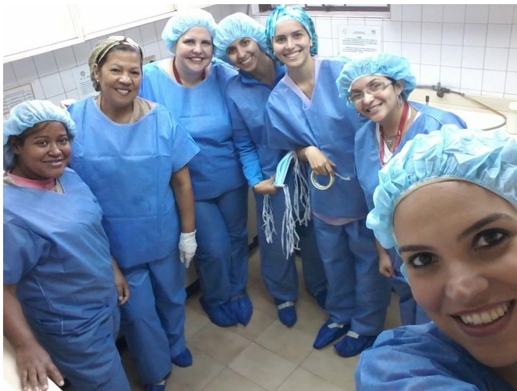
Grupo 3 de Prácticas en el Curso Medio de Bancos de Leche humana y Lactarios institucionales, en el Banco de leche del Hospital Universitario de Caracas