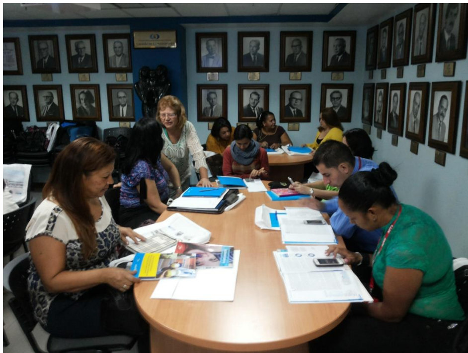
Revisión de material bibliográfico entregado en el Primera sesión Teórica del Curso Medio de Bancos de Leche humana y Lactarios institucionales