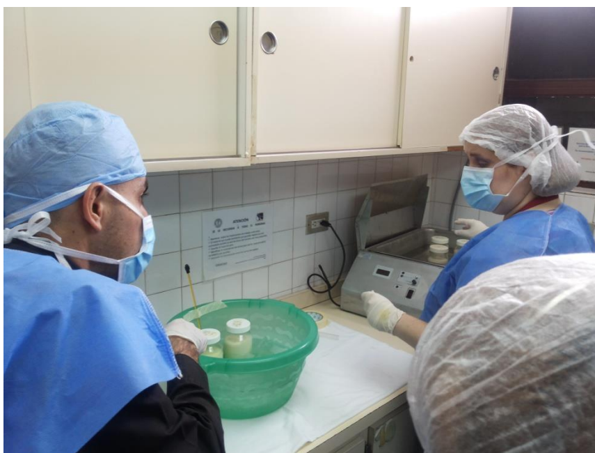
Sesión Práctica del Curso Medio de Bancos de Leche humana y Lactarios institucionales. En la foto: Enfriamiento rápido luego de la pasteurización en el Banco de leche del Hospital Universitario de Caracas