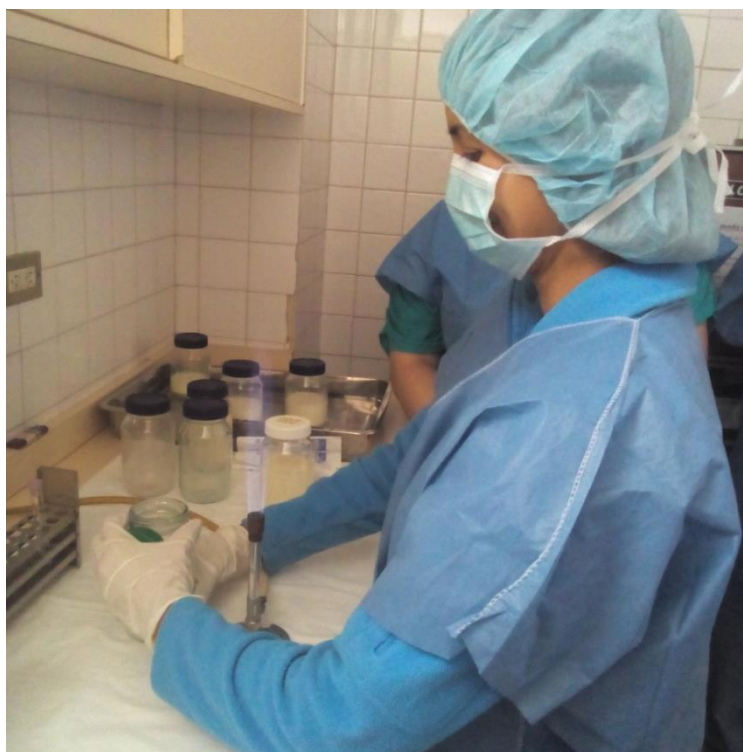
Sesión Práctica del Curso Medio de Bancos de Leche humana y Lactarios institucionales. En la foto: Transvasado de leche humana para su pasteurización en el Banco de leche del Hospital Universitario de Caracas