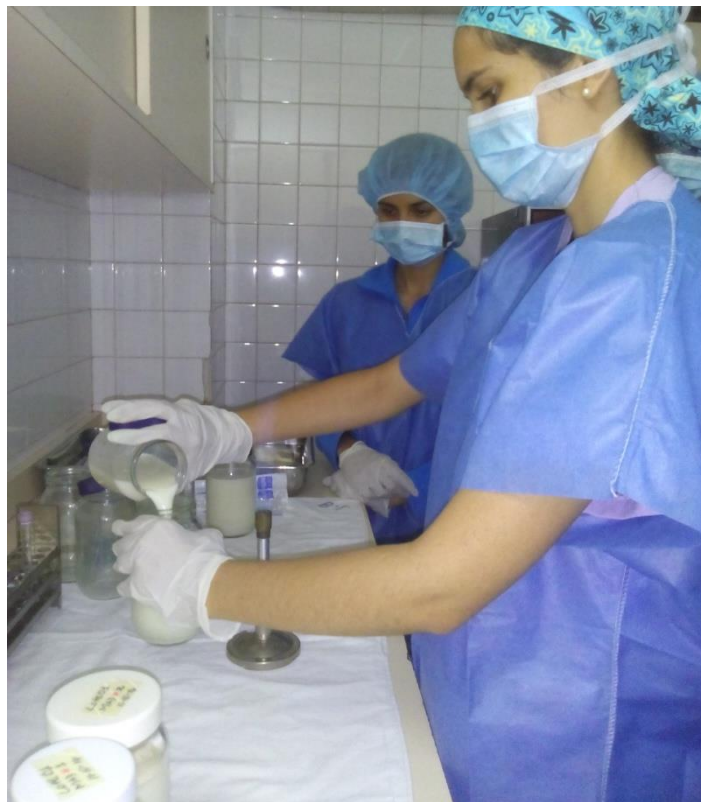
Sesión Práctica del Curso Medio de Bancos de Leche humana y Lactarios institucionales. En la foto: Transvasado de leche humana para su pasteurización en el Banco de leche del Hospital Universitario de Caracas