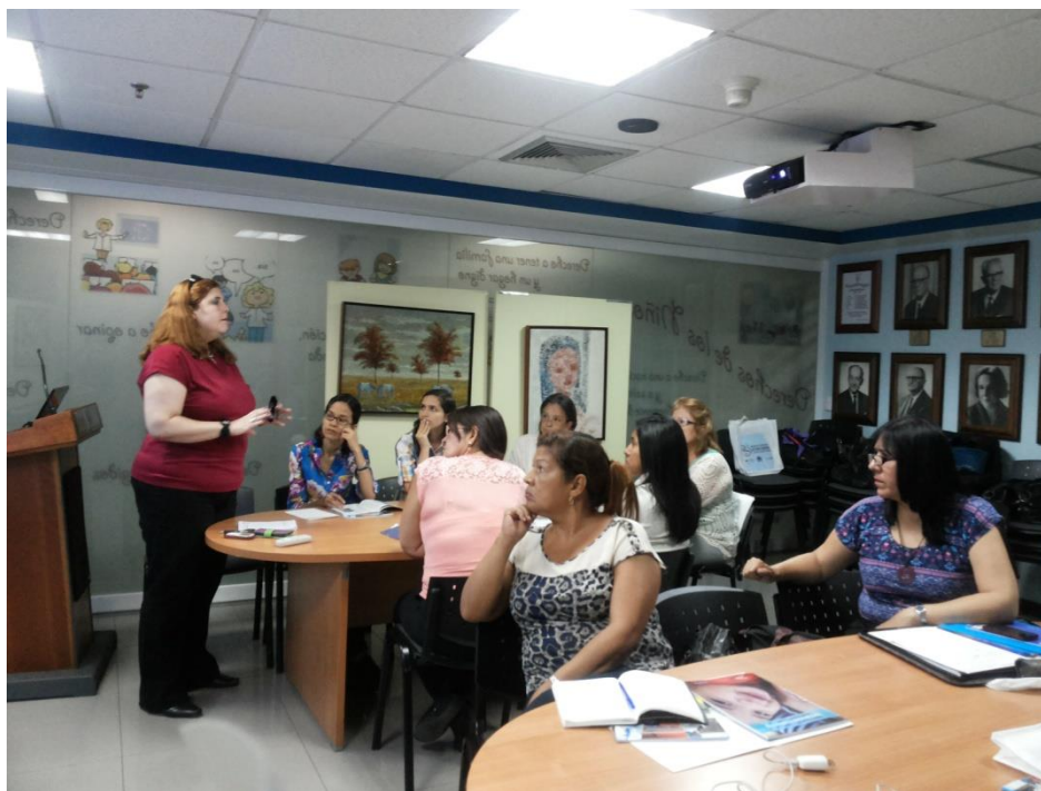
Sesión Teórica del Curso Medio de Bancos de Leche humana y Lactarios institucionales