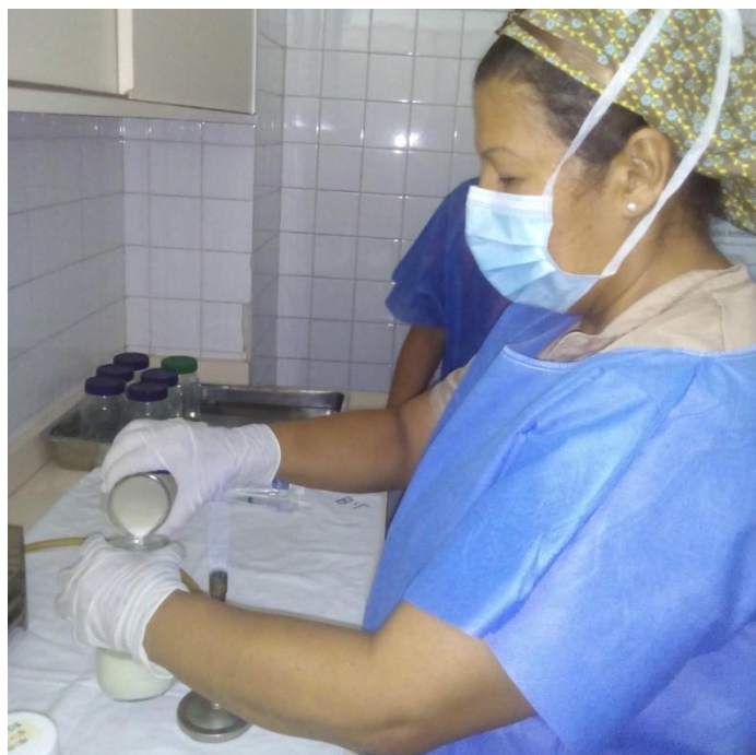
Sesión Práctica del Curso Medio de Bancos de Leche humana y Lactarios institucionales. En la foto: Transvasado de leche humana para su pasteurización en el Banco de leche del Hospital Universitario de Caracas