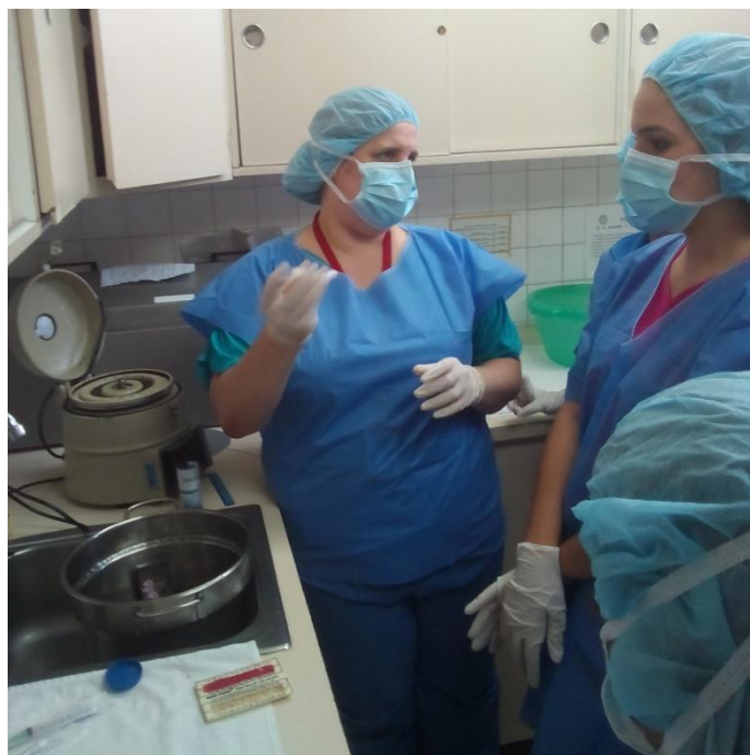
Sesión Práctica del Curso Medio de Bancos de Leche humana y Lactarios institucionales. En la foto: Análisis de crematocrito a la leche humana pasteurizada en el Banco de leche del Hospital Universitario de Caracas