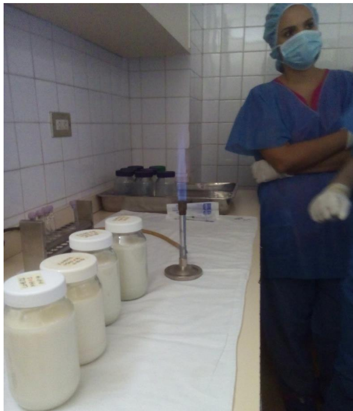
Sesión Práctica del Curso Medio de Bancos de Leche humana y Lactarios institucionales. En la foto: Clasificación de la leche humana previo a su pasteurización en el Banco de leche del Hospital Universitario de Caracas