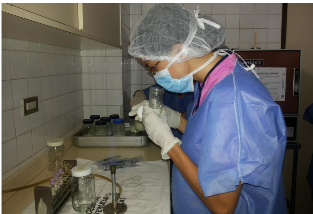
Sesión Práctica del Curso Medio de Bancos de Leche humana y Lactarios institucionales. En la foto: Evaluación sensorial para la selección de leche a ser sometida a Pasteurización en el Banco de leche del Hospital Universitario de Caracas