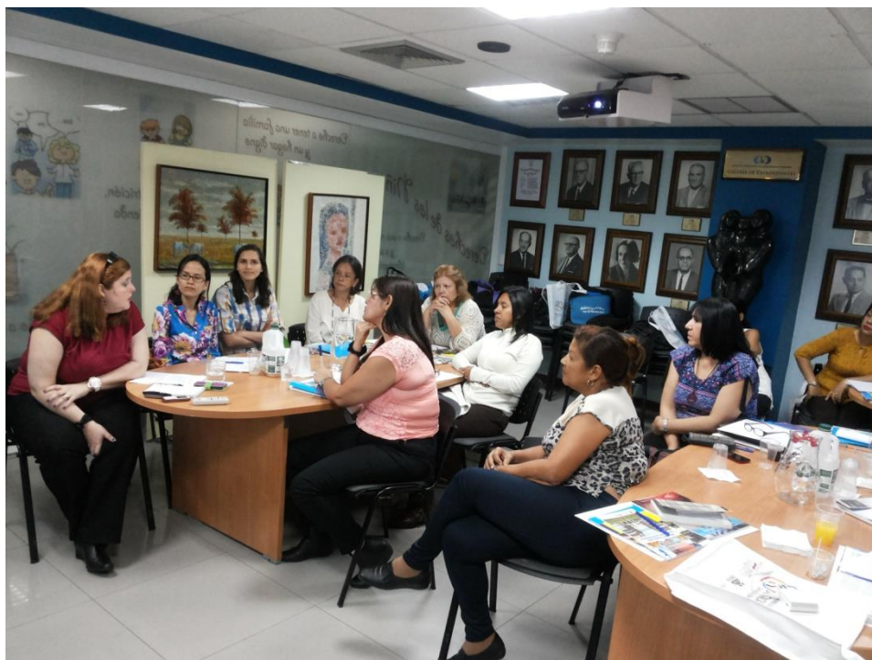
Sesión Teórica del Curso Medio de Bancos de Leche humana y Lactarios institucionales