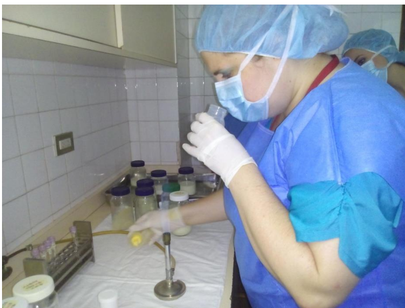
Sesión Práctica del Curso Medio de Bancos de Leche humana y Lactarios institucionales. En la foto: Evaluación sensorial para la selección de leche a ser sometida a Pasteurización en el Banco de leche del Hospital Universitario de Caracas