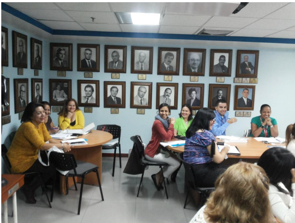
Sesión Teórica del Curso Medio de Bancos de Leche humana y Lactarios institucionales