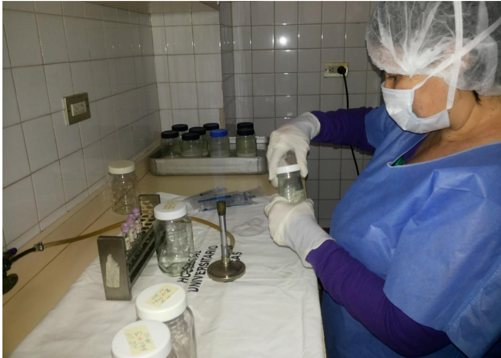
Sesión Práctica del Curso Medio de Bancos de Leche humana y Lactarios institucionales. En la foto: Evaluación sensorial para la selección de leche a ser sometida a Pasteurización en el Banco de leche del Hospital Universitario de Caracas