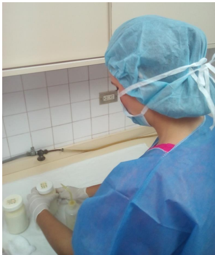
Sesión Práctica del Curso Medio de Bancos de Leche humana y Lactarios institucionales. En la foto: Higienización de los frascos de leche previo a su pasteurización en el Banco de leche humana del Hospital Universitario de Caracas