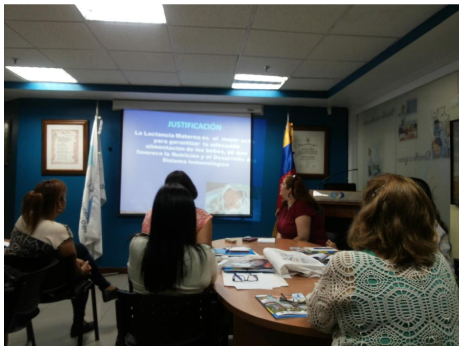
Sesión Teórica del Curso Medio de Bancos de Leche humana y Lactarios institucionales