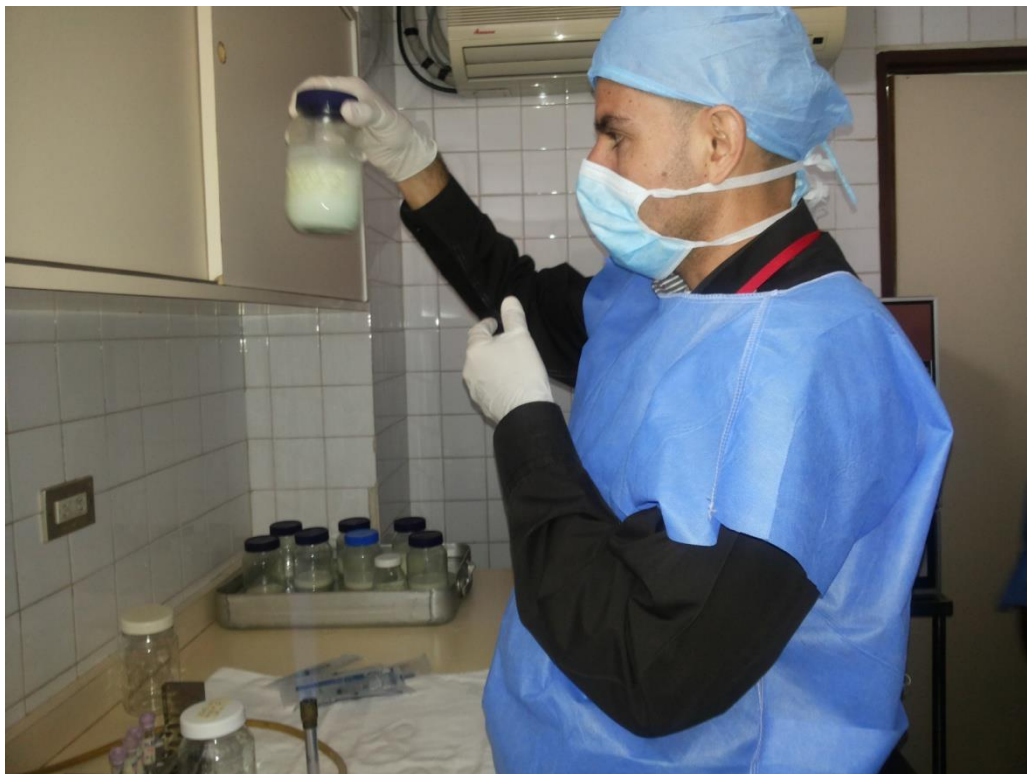
Sesión Práctica del Curso Medio de Bancos de Leche humana y Lactarios institucionales. En la foto: Evaluación sensorial para la selección de leche a ser sometida a Pasteurización en el Banco de leche del Hospital Universitario de Caracas