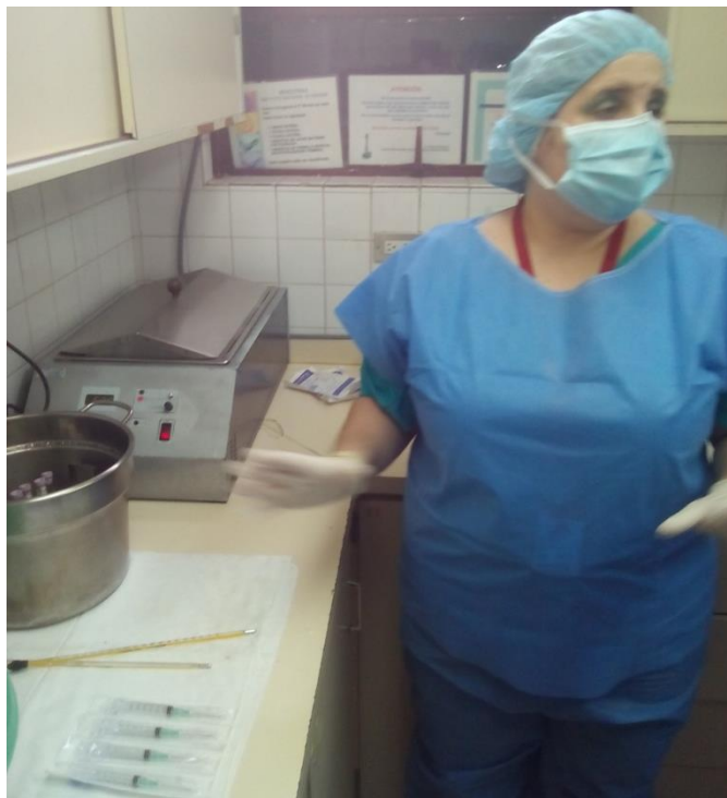
Sesión Práctica del Curso Medio de Bancos de Leche humana y Lactarios institucionales. En la foto: Pasteurización de leche humana en el Banco de leche del Hospital Universitario de Caracas