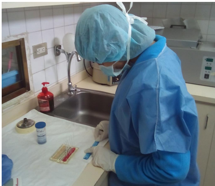
Sesión Práctica del Curso Medio de Bancos de Leche humana y Lactarios institucionales. En la foto: Análisis de crematocrito a la leche humana pasteurizada en el Banco de leche del Hospital Universitario de Caracas