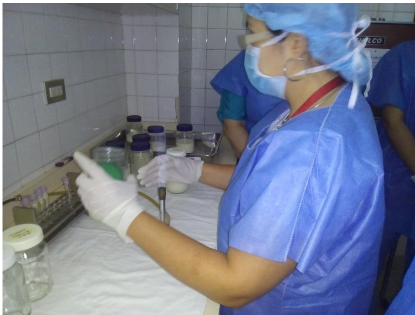
Sesión Práctica del Curso Medio de Bancos de Leche humana y Lactarios institucionales. En la foto: Transvasado de leche humana para su pasteurización en el Banco de leche del Hospital Universitario de Caracas