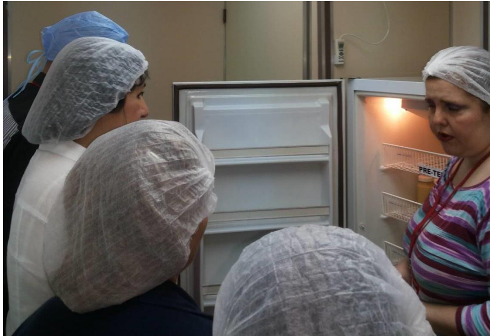
Sesión Práctica del Curso Medio de Bancos de Leche humana y Lactarios institucionales. En la foto: Recorrido por las áreas del Banco de leche del Hospital Universitario de Caracas