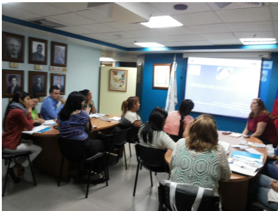
Sesión Teórica del Curso Medio de Bancos de Leche humana y Lactarios institucionales