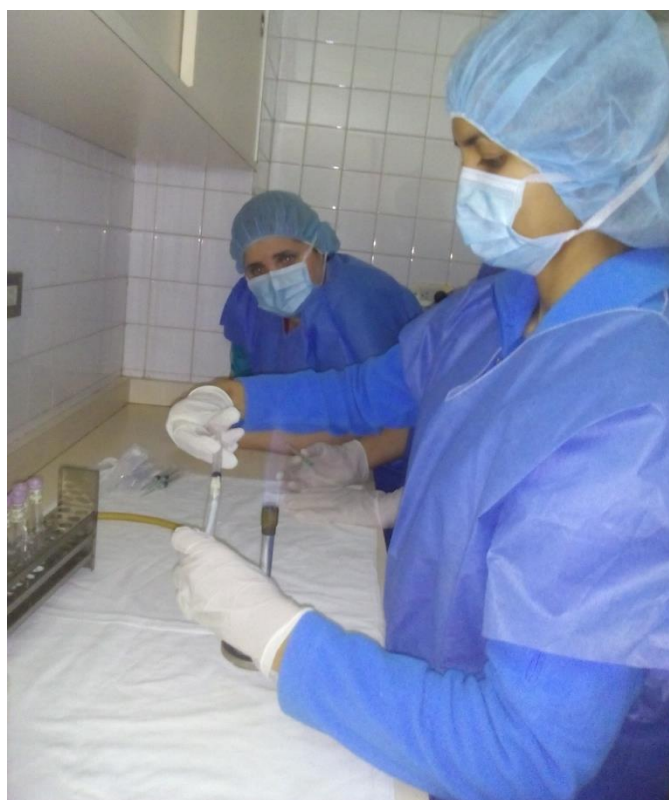
Sesión Práctica del Curso Medio de Bancos de Leche humana y Lactarios institucionales. En la foto: Toma de muestras de la leche para su análisis nutricional en el Banco de leche del Hospital Universitario de Caracas