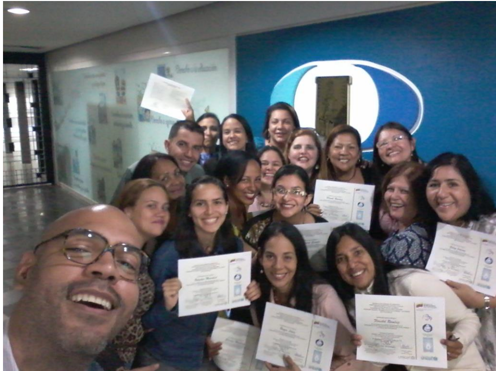
Entrega de certificados del Curso Medio de Actualización en Bancos de Leche humana y Lactarios institucionales