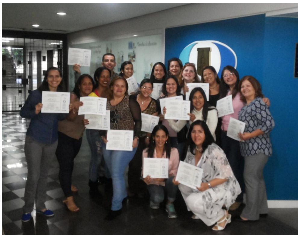
Entrega de certificados del Curso Medio de Actualización en Bancos de Leche humana y Lactarios institucionales