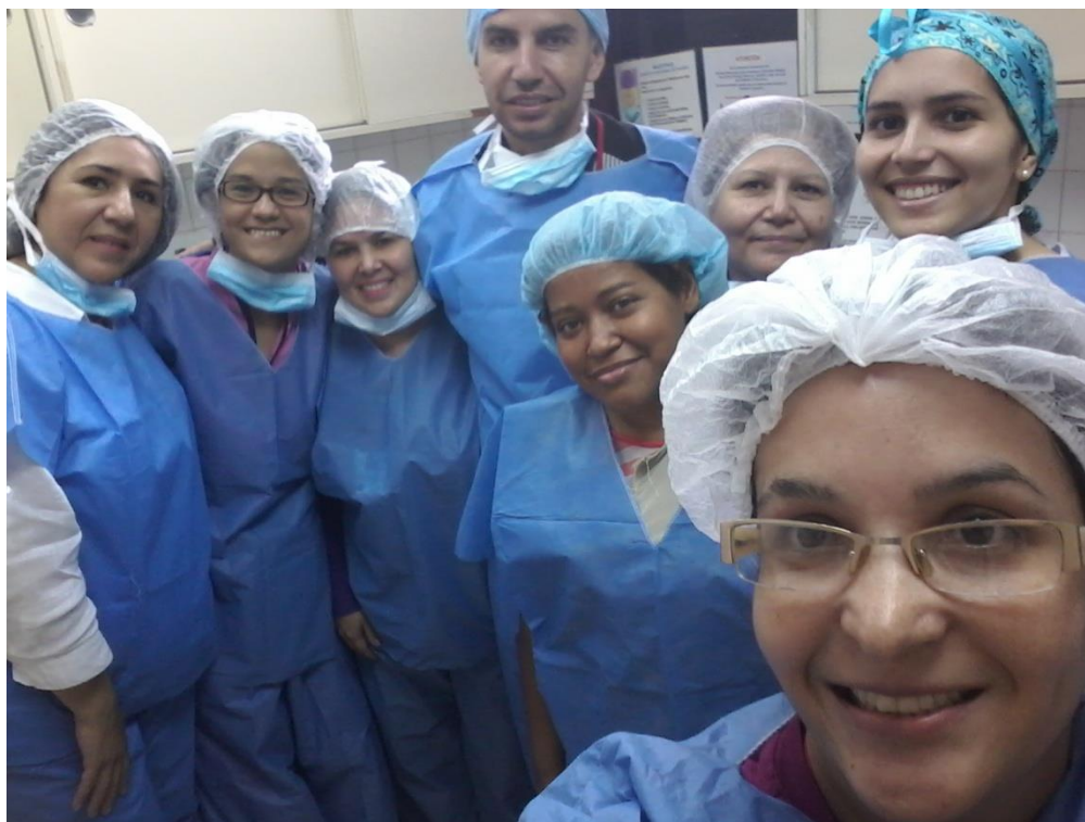
Grupo 1 de Prácticas en el Curso Medio de Bancos de Leche humana y Lactarios institucionales, en el Banco de leche del Hospital Universitario de Caracas