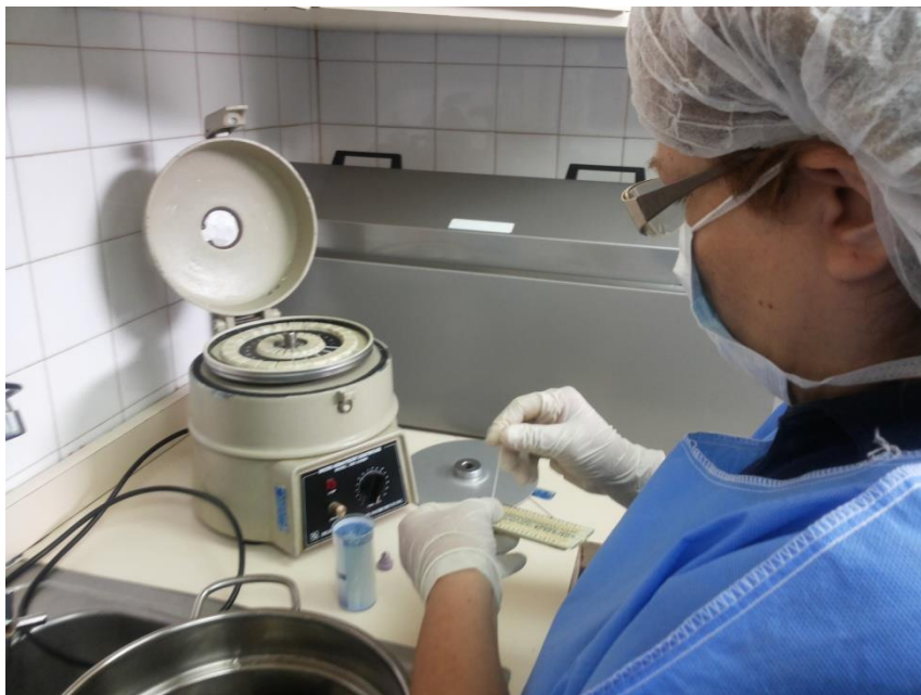
Sesión Práctica del Curso Medio de Bancos de Leche humana y Lactarios institucionales. En la foto: Análisis de crematocrito a la leche humana pasteurizada en el Banco de leche del Hospital Universitario de Caracas