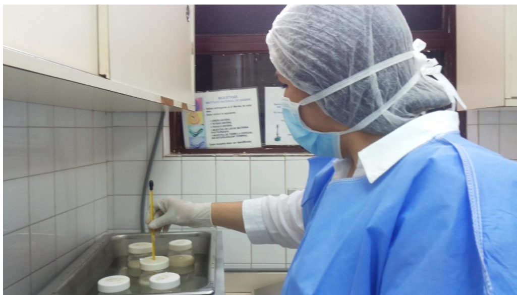
Sesión Práctica del Curso Medio de Bancos de Leche humana y Lactarios institucionales. En la foto: Control de temperatura en el Punto frío durante Pasteurización de leche humana en el Banco de leche del Hospital Universitario de Caracas