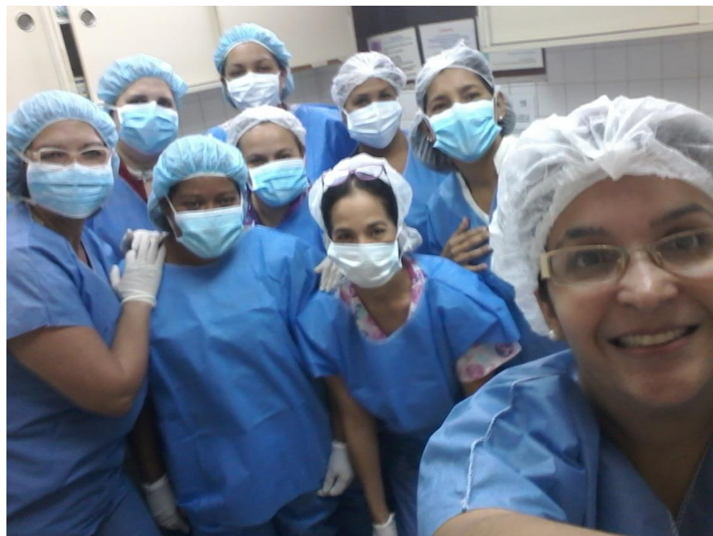
Grupo 2 de Prácticas en el Curso Medio de Bancos de Leche humana y Lactarios institucionales, en el Banco de leche del Hospital Universitario de Caracas